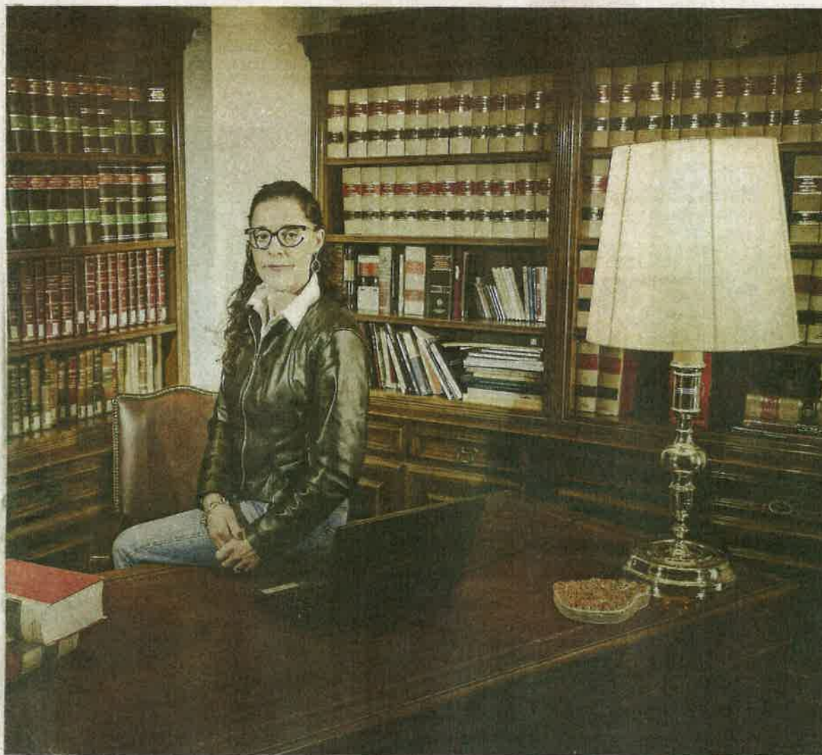
La nueva decana del Colegio de Abogados de Soria en la sede colegial.