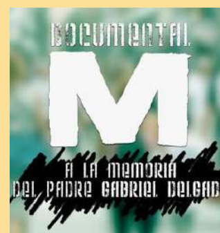
Viernes 31 /11:30 h. DOCUMENTAL "M" LA VOZ A ELLOS DEBIDA