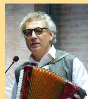
Viernes 31 /19:00 h. JUAN CARLOS MESTRE POETA