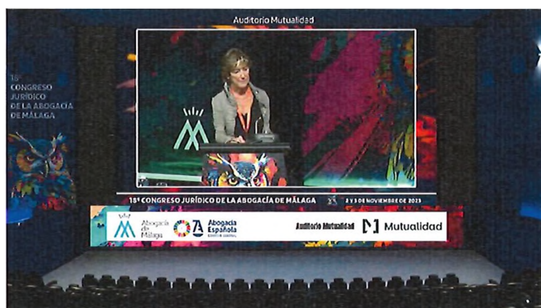
Auditorio principal logo CGAE

IV.- AULAS VIRTUALES – RETRANSMISIÓN CONGRESO ONLINE. Inclusión de imagen/logo del Consejo General de la Abogacía en el marco de todas las salas virtuales donde accederán los congresistas para ver todas las ponencias en directo, así como en diferido una vez realizado el congreso: