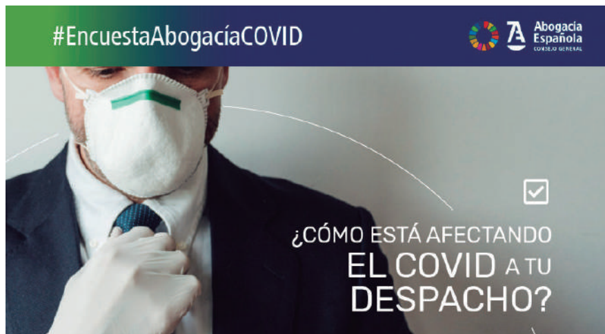
Imagen de la encuesta

Solidaridad, tecnología y formación. Esas son las tres respuestas que los abogados y abogadas españoles consideraron que debían ofrecerse ante la crisis del Covid-19 y sus consecuencias asociadas. Lo que se traduce en ayudas directas para los colegiados que han sufrido el impacto económico de esta crisis con mayor dureza, más y mejores servicios tecnológicos para hacer posible el trabajo telemático y mejorar en eficacia, y formación tanto en materia jurídica como por lo que se refiere al resto de habilidades necesarias para el ejercicio de la profesión. Estas conclusiones se extraen de una encuesta realizada por el Consejo General de la Abogacía Española a través de su página web en noviembre y en la que participaron más de 10.000 colegiados de toda la geografía nacional. De entre quienes la completaron, una amplia mayoría (55%) consideró que la respuesta más adecuada del arco institucional de la abogacía debe ser una combinación de esos tres frentes: ayudas económicas directas, tecnología y formación.