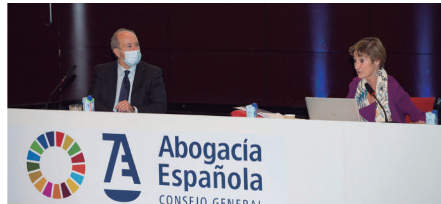
Visita de Juan Carlos Campo al Pleno del Consejo General de la Abogacía

El ministro de Justicia, Juan Carlos Campo, intervino el 11 de diciembre en el Pleno del Consejo General de la Abogacía Española, donde anunció la próxima presentación de una nueva propuesta de métodos de solución de controversias, que formará parte esencial del Anteproyecto de Medidas de Eficiencia Procesal. El ministro también abordó temas de gran importancia para la abogacía como los trabajos para la propuesta de la Ley del Derecho de Defensa y el anteproyecto de reforma de la Ley de Enjuiciamiento Criminal.