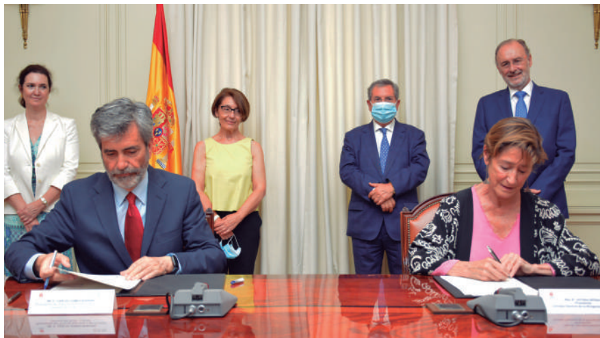
Firma del convenio para impulsar la mediación entre Carlos Lesmes y Victoria Ortega

Con la rúbrica de este acuerdo, el órgano de gobierno de los jueces y la Abogacía cumplen las normas europeas sobre mediación y la recomendación dirigida por el Parlamento Europeo a los Estados miembros para que intensifiquen sus esfuerzos en el impulso del uso de la mediación en litigios civiles y mercantiles y en la mejora de la colaboración entre los profesionales de la justicia con este mismo fin. Este convenio supone un nuevo marco regulador con adaptación a la legislación vigente respecto al firmado en junio de 2016.