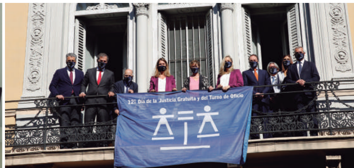
Consejo General de la abogacía Española