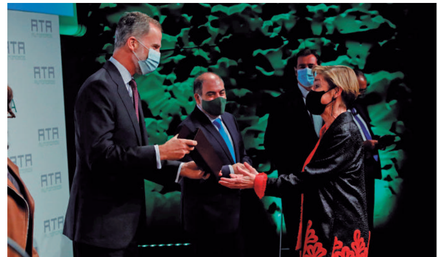
El Rey Felipe VI entrega el premio de ATA concedido a la Abogacía a su presidenta, Victoria Ortega

El Consejo General de la Abogacía Española fue una de las corporaciones profesionales premiadas por la Federación Nacional de Asociaciones de Trabajadores Autónomos-ATA por su labor esencial para los autónomos durante el estado de alarma y que lo siguen siendo hasta el fin de la pandemia. En la XIX Edición de sus Premios Autónomo del Año unificó la gran parte de las categorías y premió en conjunto a todos los colectivos que fueron esenciales para los autónomos durante el estado de alarma y que lo siguen siendo hasta el fin de la pandemia.