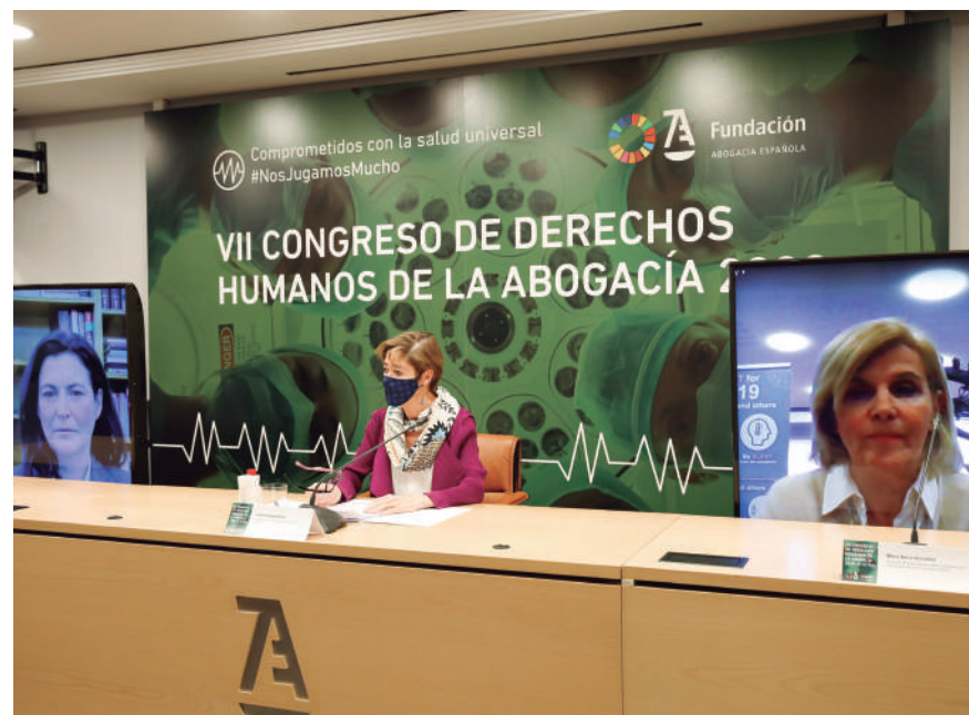
Inauguración del Congreso de Derechos Humanos de la Fundación Abogacía a cargo de Victoria Ortega, María Neira y Raquel Yotti

En cuanto a los temas tratados, hubo ponencias sobre el marco jurídico del Derecho a la salud en España y su funcionamiento durante la pandemia de la Covid-19; la distribución de la vacuna y si España está preparada para su distribución; el empleo de nuevas tecnologías en el acceso universal a la salud; el impacto del modelo sanitario en el acceso a la salud; o la pandemia Covid-19 y la alerta que ha provocado en relación con las personas mayores. Finalmente, para terminar el Congreso, se presentó el “Decálogo de la Abogacía Española para la protección de los Derechos Humanos en pandemias”, coordinado por Francisca Sauquillo, presidenta de Movimiento por la Paz y Premio Derechos Humanos de la Abogacía en 2015.