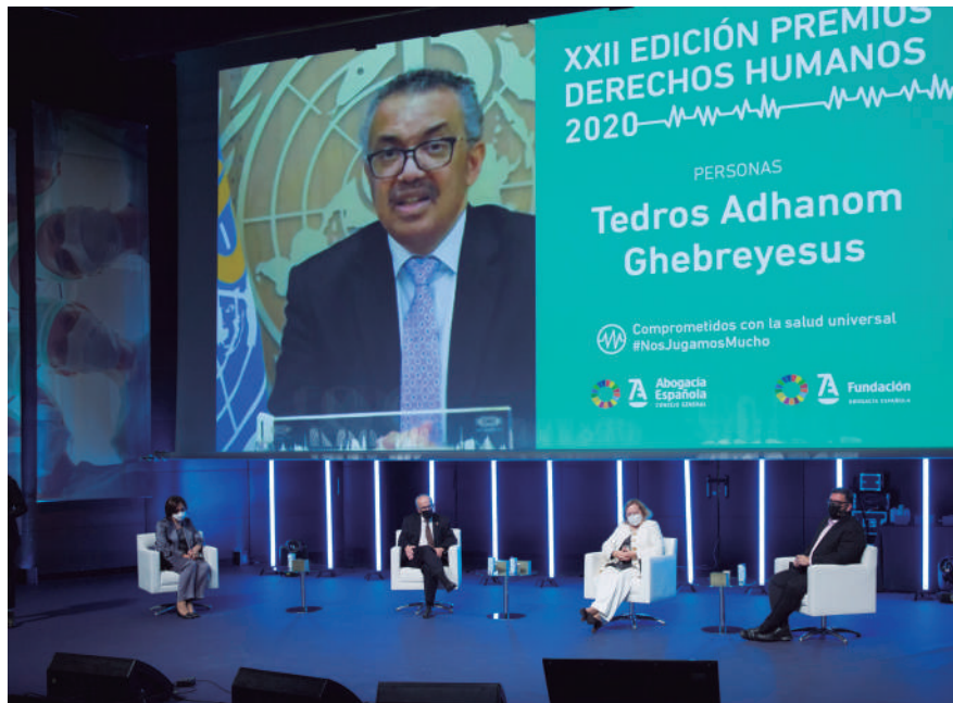
Los Premiadados con los Premios Derechos Humanos 2020 durante la Conferencia Anual de la Abogacía

En esta edición se presentaron 40 candidaturas, 13 en la categoría de personas,