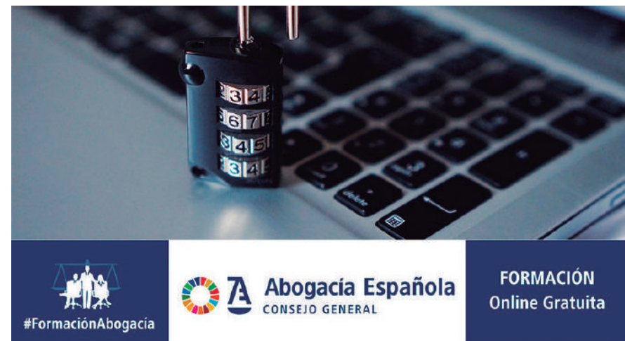
Imagen de una de las Jornadas online celebradas con temática Covid-19

Las conferencias fueron todo un éxito de participación, ya que más de 1.000 abogados se conectaron a cada una de ellas durante toda la duración de éste programa especial, enmarcado dentro del Plan Formativo que ha elaborado el Consejo General de la Abogacía para los Colegios y sus colegiados. Los temas tratados en las Conferencias Especial Covid-19 estuvieron relacionados con la pandemia y los problemas jurídicos derivados de ella. Las jornadas comenzaron con "Teletrabajo, Pri-