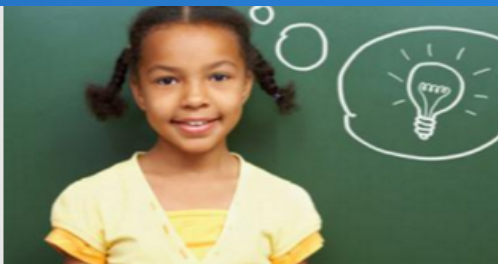
Children & Youth