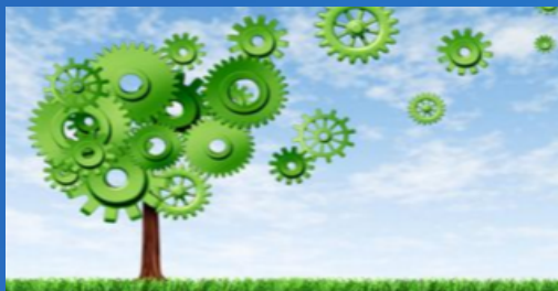
Business & Industry