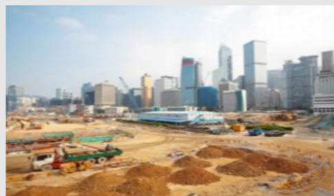
Workers & Trade Unions