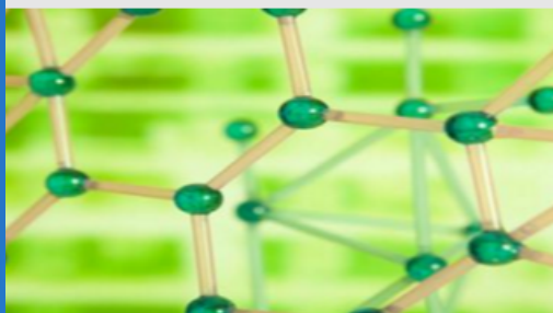
Scientific & Technological Community