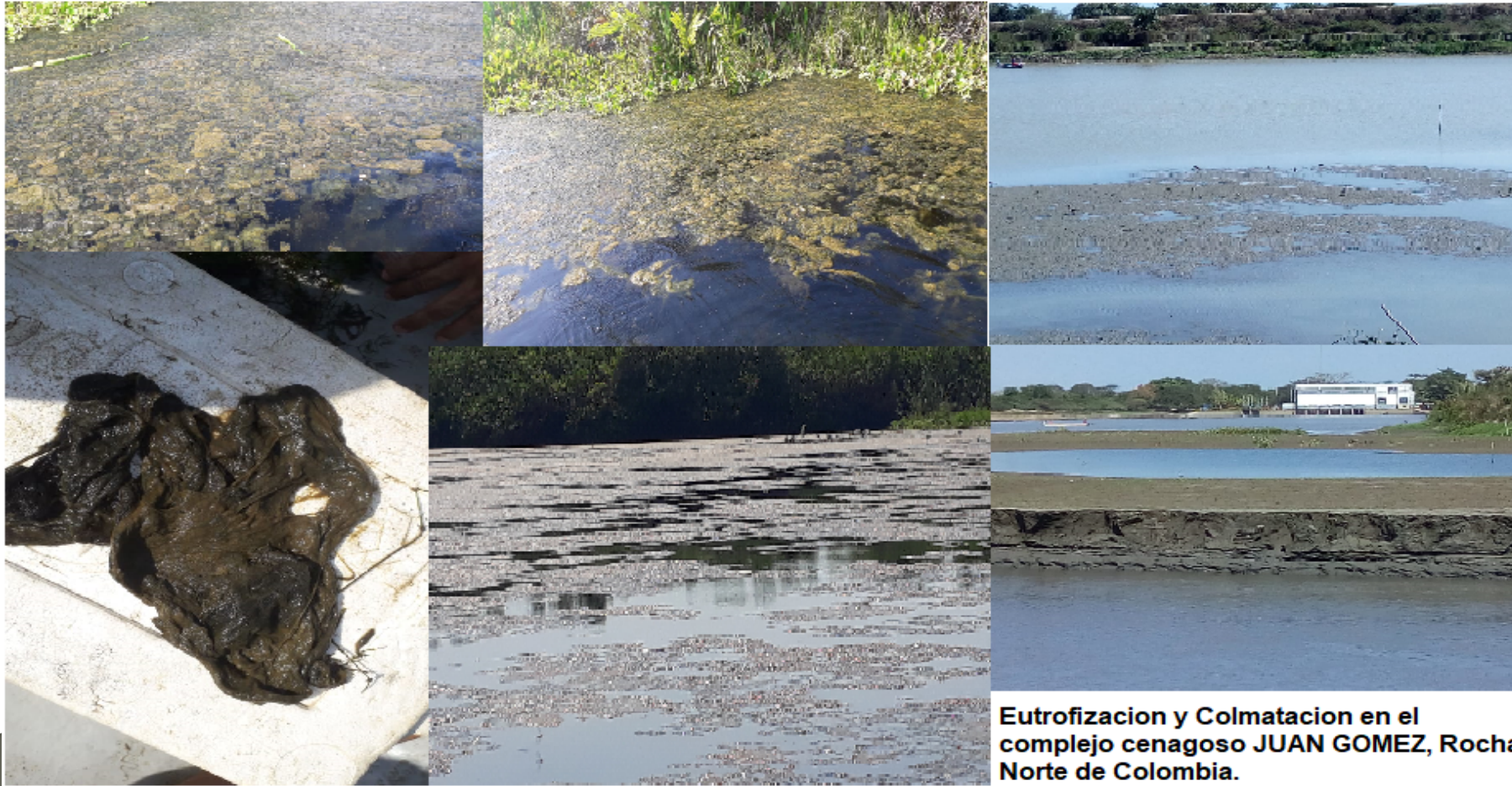
Eutrofización y Colmatación en el complejo cenagoso JUAN GOMEZ, Rocha Norte de Colombia.