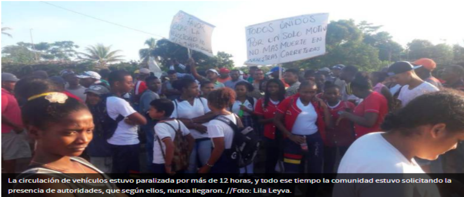
La circulación de vehículos estuvo paralizada por más de 12 horas, y todo ese tiempo la comunidad estuvo solicitando la presencia de autoridades, que según ellos, nunca llegaron.

LILA LEYVA VILLARREAL - CORRESPONSAL EL UNIVERSAL | @ElUniversalCtg | 20 de noviembre de 2019 12:00 AM |