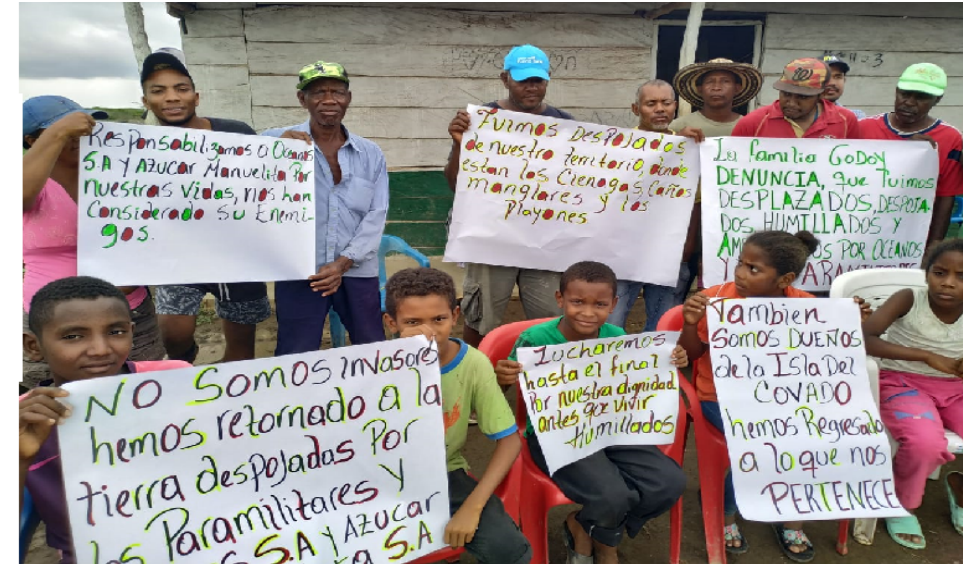
The displaced families of the community of Lomas de Matunilla denounce that they are invaders and that they have rights