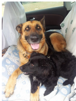
Tania DeAnimals Guardamar 2016