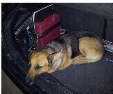
Tania 2012 abandonada y atropellada en la autovía