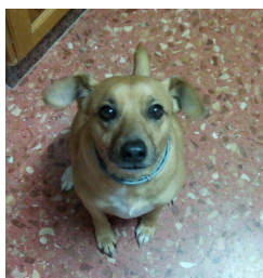
Garri DeAnimals 2016 (Policía local Cartagena)