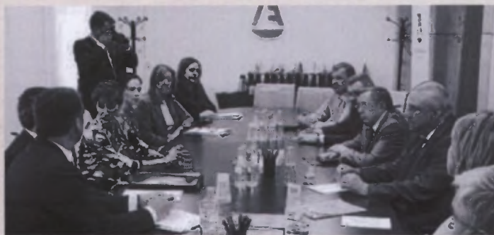
La delegación rusa tuvo una reunión de trabajo en el Consejo General de la Abogacía Española (CGAE).

"Los juzgados están sobrecargados en Rusia y necesitamos otras vías, como la mediación"