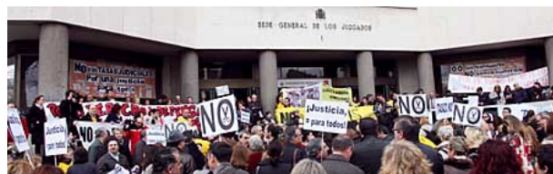
Manifestación de jueces contra las tasas en los Juzgados de Plaza de Castilla.